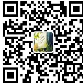
微信公众号 清华经管在职硕士